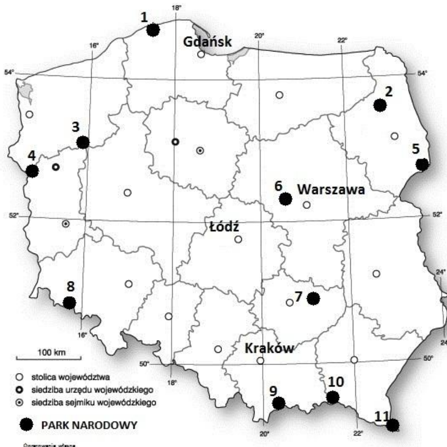
Ryc. 1 Mapa z podziałem administracyjnym Polski

Zadania 1 – 3 rozwiąż w oparciu o Mapę z podziałem administracyjnym Polski (Ryc.1)